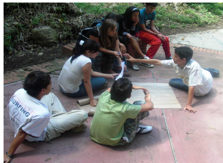
Trabajo con los NNA EN .....

problemáticas y las de los demás, queremos intervenir, opinar, indagar, que nos pregunten, que nos enseñen, que nos den espacios para proponer nuestras ideas e inquietudes, sin más palabras soñamos con ser tratados como ciudadanos con todos los derechos y que nos muestren y vivamos con las condiciones básicas para la vida en sociedad y para ejercer la libertad.